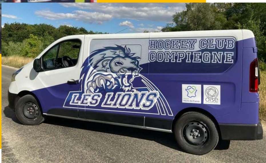
Renault Traffic (Acquis en 2019)