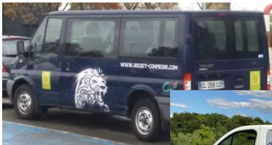
Ford Transit (Acquis en 2012)

Nous proposons la poste de stickers sur les minibus du club en fonction de la formule de partenariat.